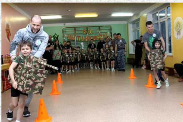
Спорт праздник «Мы танкисты»

Собрав информацию по истории создания УДТК, оформив экспозиции в музее, торжественным мероприятием открыли наш музей для посещения детей других групп. В процессе создания музея были проведены мероприятия с родителями: спортивный праздник, акция «Посылка солдату» и «Письмо солдату».