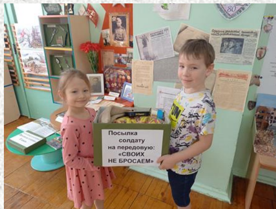
Акция «Посылка солдату»