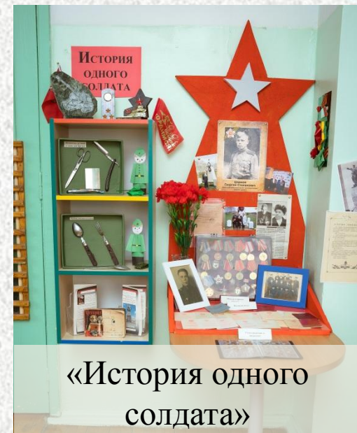
«История одного солдата»

Музей расположен в групповой комнате, является мобильным. Музей представлен в семи разделах: «Подвиг УДТК», «Урал -фронту», «История одного солдата», «Штаб», «Страницы той войны», «Танки Победы», «Народная память»