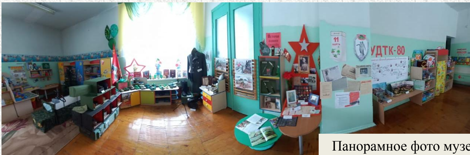
Панорамное фото музея