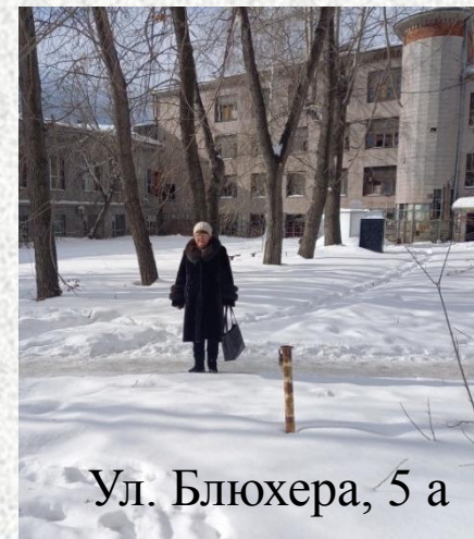
Ул. Блюхера, 5 а