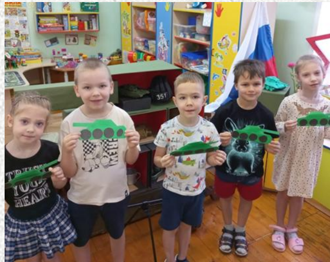
Оригами «Танки Победы»