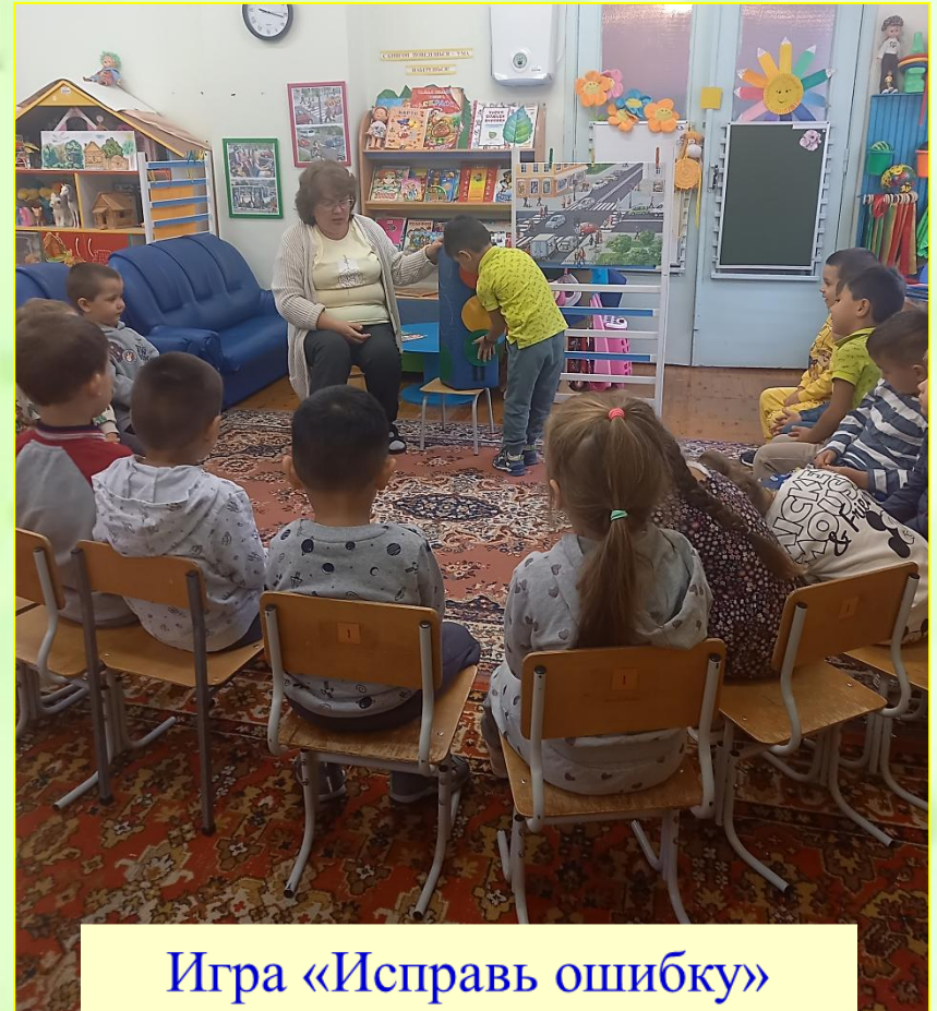
Игра «Исправь ошибку»