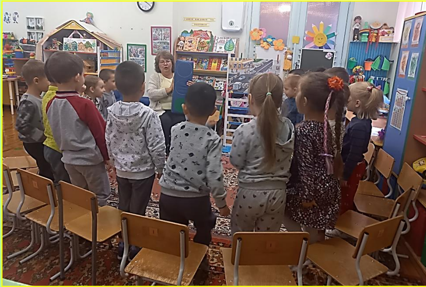
Игра «На зеленый свет иди, а на красный посиди»