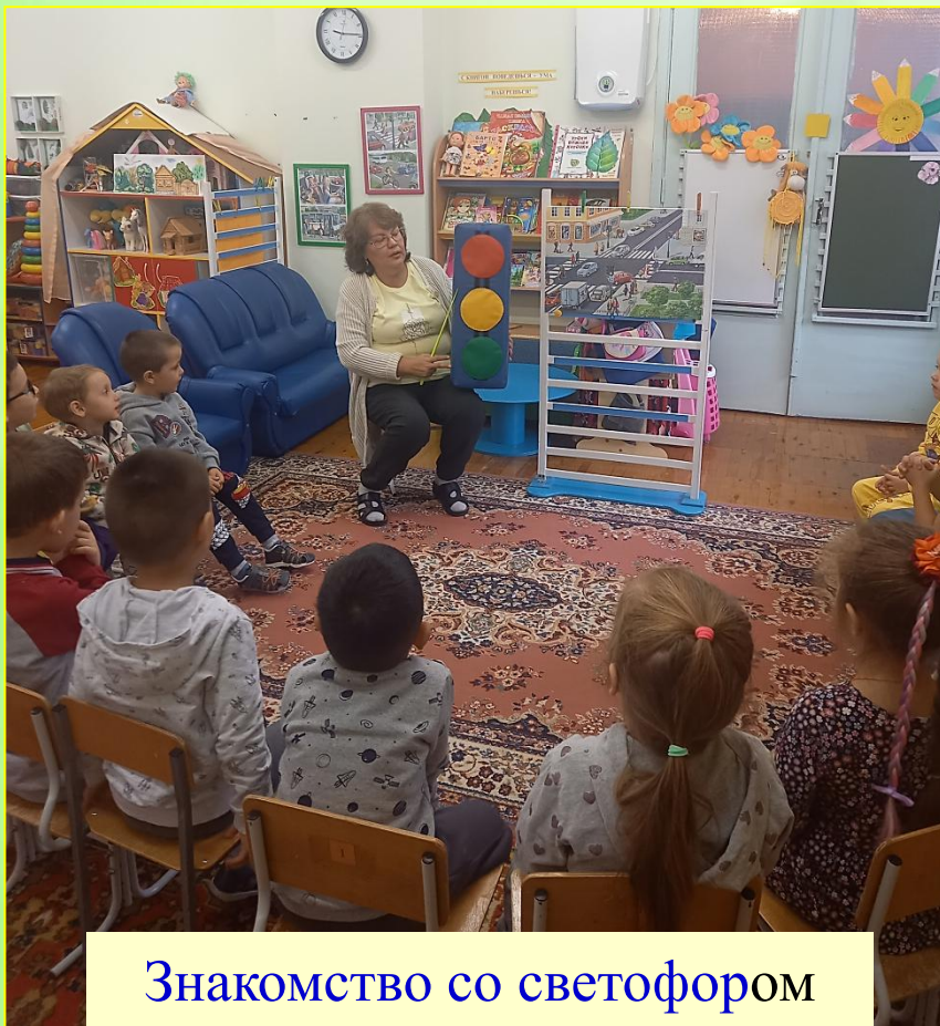
Знакомство со светофором

Цель: Познакомить детей с правилами дорожного движения, со светофором. Учить понимать значение световых сигналов светофора. Формировать начальные навыки безопасного поведения на дороге и на улице.