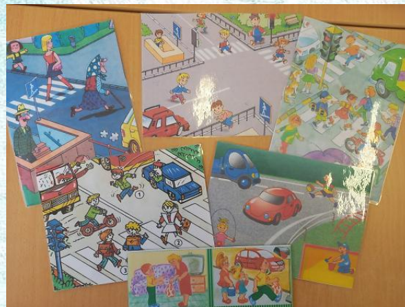
Игра «Найди нарушителя»