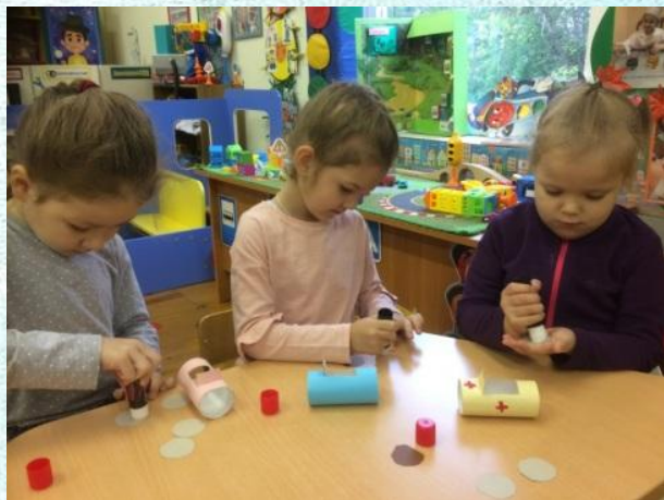
«Машина» из втулки