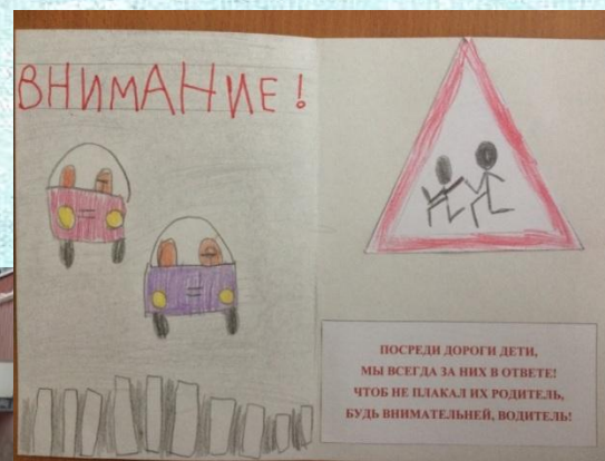
Памятка «Будь внимателен, водитель!»