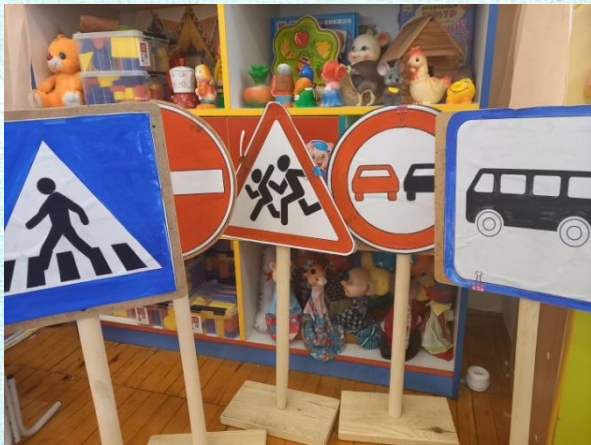
«Дорожные знаки» напольные