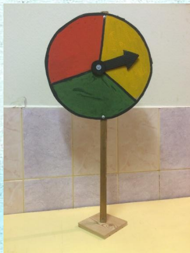
Макет «Первый в России светофор»