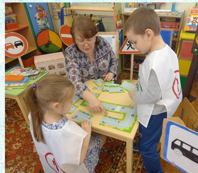
Игра «Построй дорогу по знакам»