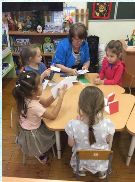
Тетрадь для игры