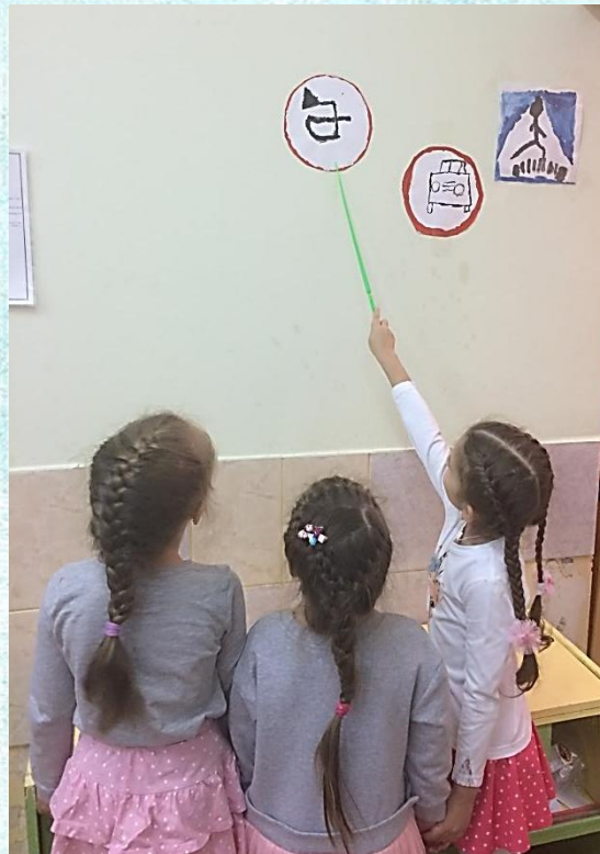
Правила группы в знаках