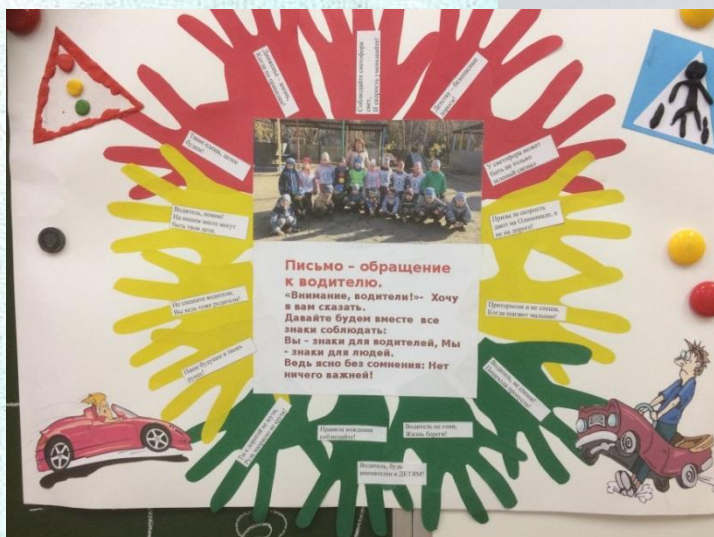
Коллективная работа «Письмо – обращение к водителю»