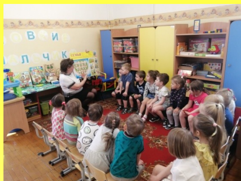
Беседа «Что такое семья?»