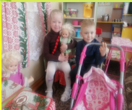
Сюжетно-ролевая игра «Дом»