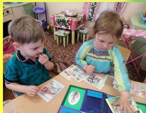
Работа с лэпбуком «Моя семья»