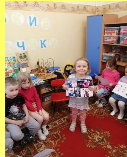
Развитие речи «Моя любимая семья»