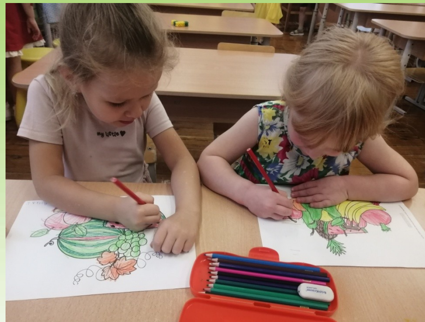
Раскрашивание натюрморта «Фрукты» Рисование «Вкусный арбуз».