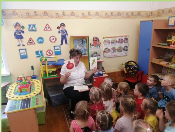
Беседа: «Овощи и фрукты, их значение в жизни человека»