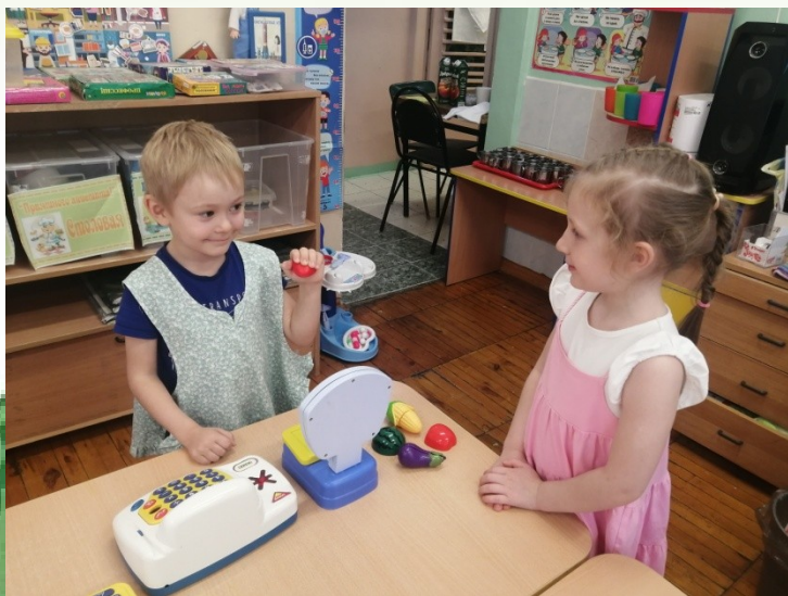
Сюжетно-ролевая игра Магазин «Овощи и фрукты»