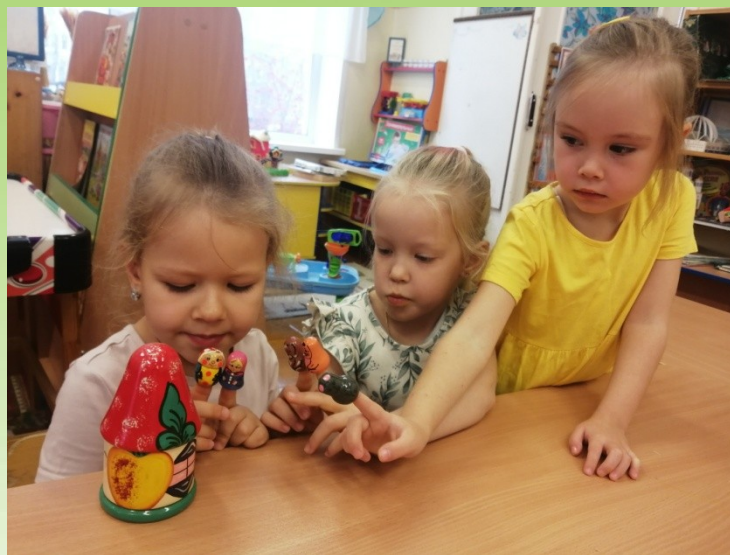
Театральная деятельность. Сказка «Репка»