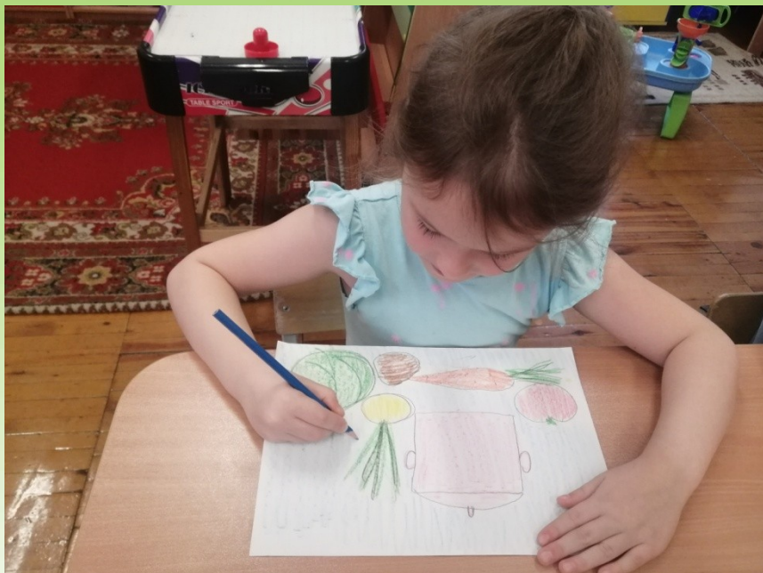
Рисование натюрморта «Овощи»