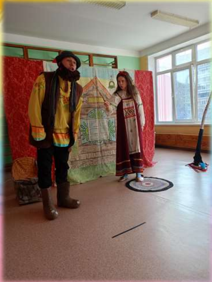
Сказка «Чур, меня чур!»