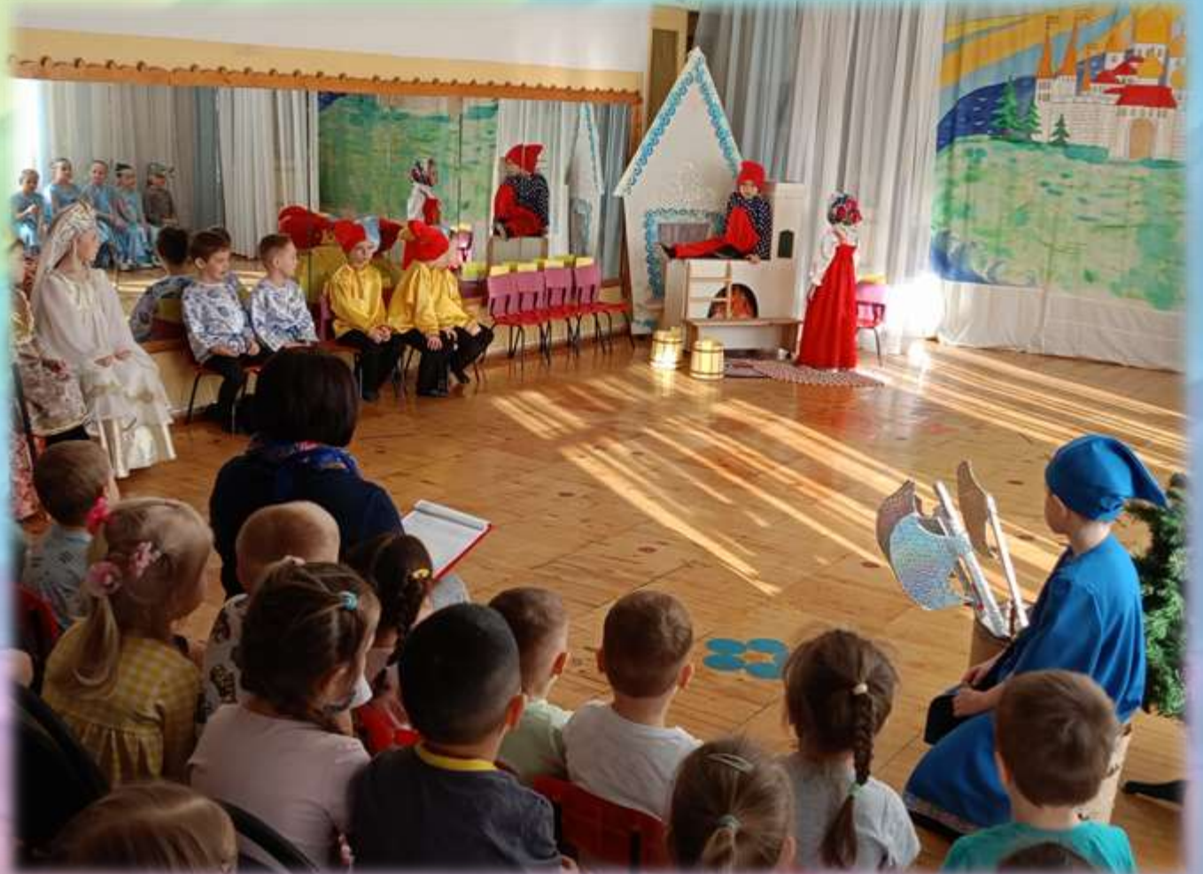
Сказка «По щучьему велению»