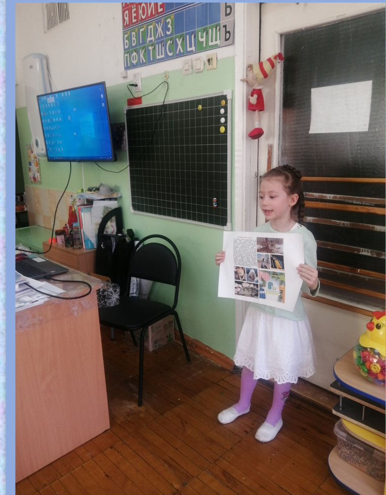
Развитие речи «Любимые места»