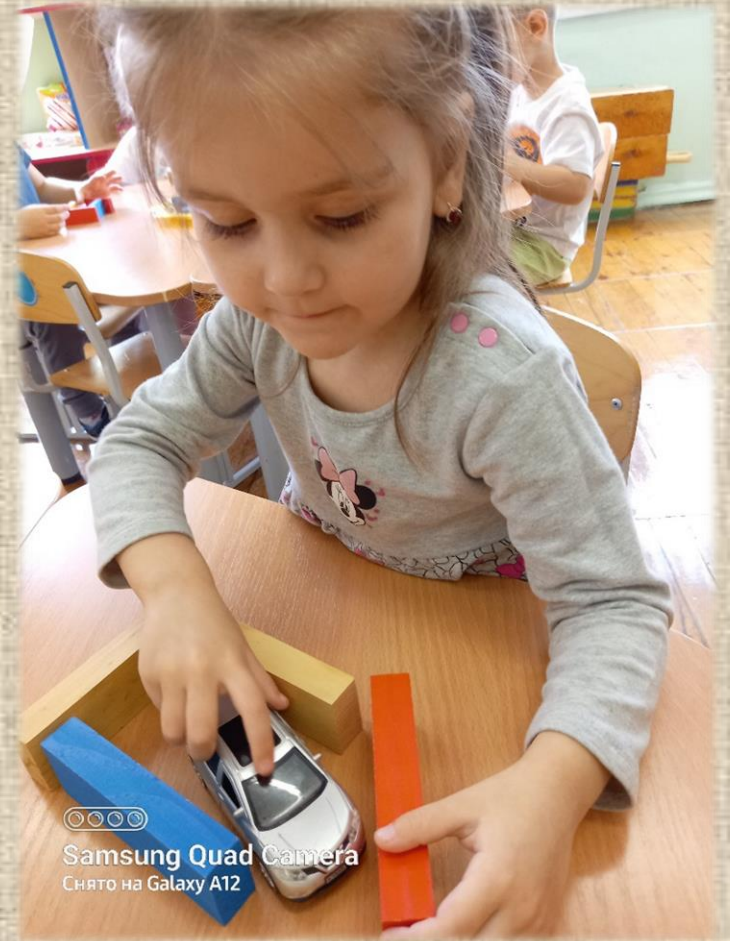
«Гараж для машины»