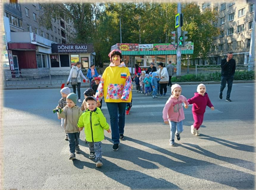
Экскурсия к перекрёстку «Как Буратино учил правила ПДД»