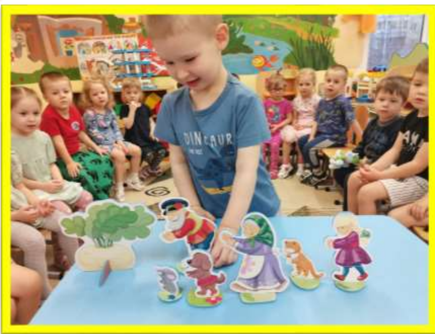
Игра «Расставь героев по порядку»