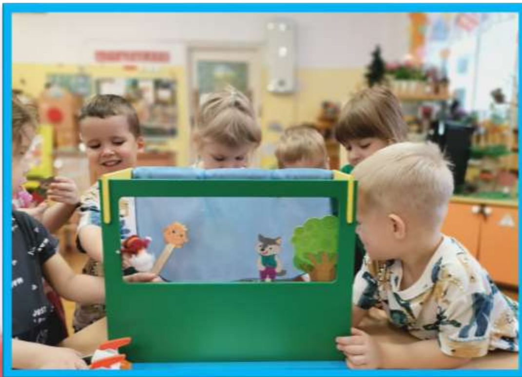
Инсценировка сказки «Колобок»