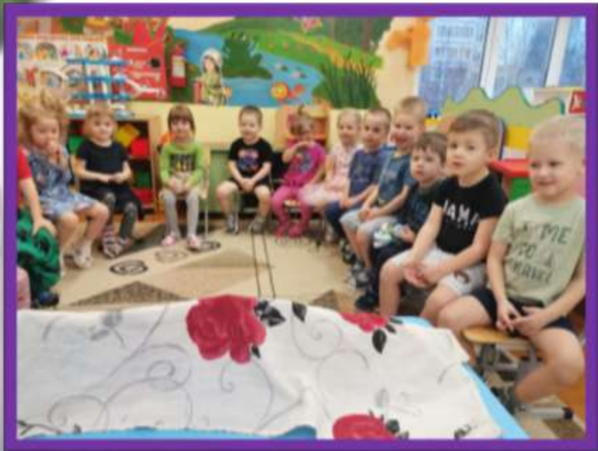
Игра «Кто пропал?»