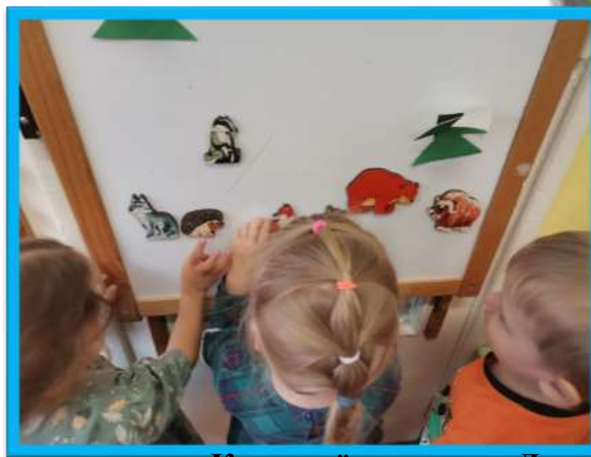
Игровые ситуации «Кто живёт в лесу», «Домики животных»