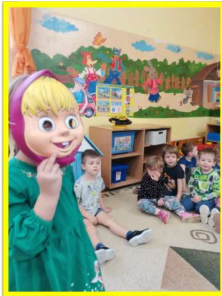
Игра «Кто я?»