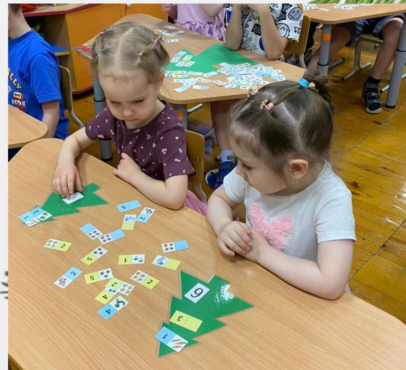
Дидактическая игра «Математическая ёлочка»