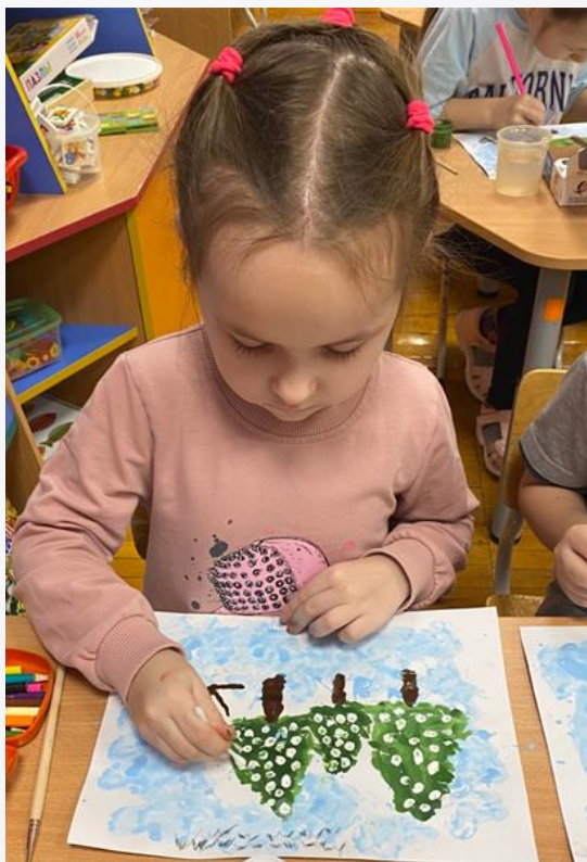
Рисование «Елочки большие и маленькие»