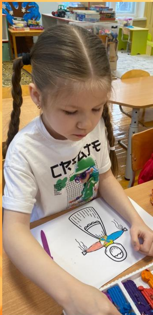
Пластинография Куколка «Масленица»

Цель проекта: формирование интереса к русским народным традициям на примере ознакомления с праздником Масленица.