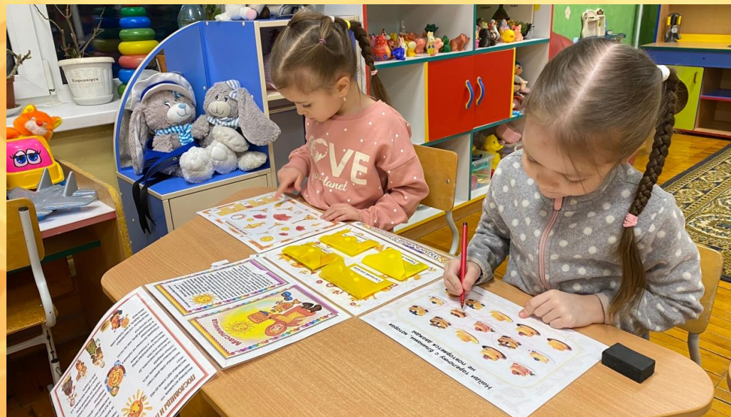
Дидактическая игра "Масленицу встречаем - зиму провожаем"