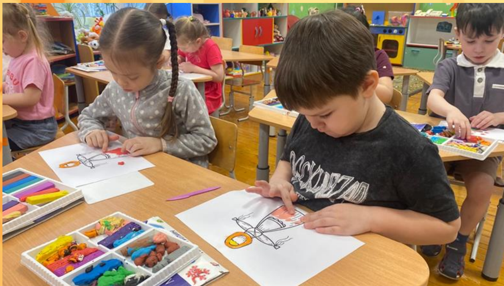
Пластимлинография «Кукла Масленица»