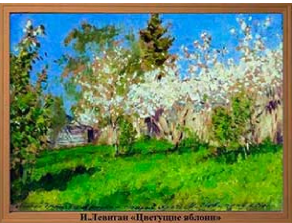
И. Левитан «Цветущие яблони»

Образовательные: продолжать знакомить с творчеством русских художников