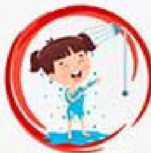
Принимайте контрастный душ