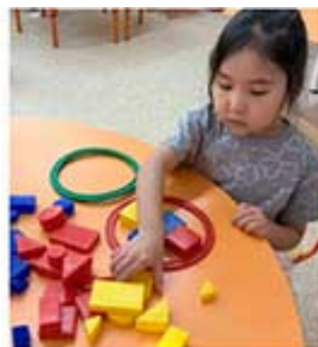
Блоки Дьенеша «Сортировка по форме»

Таким образом, можно отметить, что логические блоки Дьенеша — это не просто развивающая игрушка, а мощный тренажер для мозга. Регулярные занятия с ними позволяют ребенку чувствовать себя уверенно в мире цифр и логических задач, подготавливая надежную базу для успешного обучения в школе. Игры и упражнения с логическими блоками мы предлагаем детям и на занятиях, и в самостоятельной игре. Для закрепления полученных на занятии знаний, в группе создан уголок развивающих игр, где дети могут в любое время позаниматься. Находясь в группе большую часть времени, ребёнок может в удобный момент