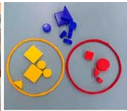
Блоки Дьенеша «Сортировка по цвету»

взять интересующий его материал и без помощи взрослого поиграть с ним, а затем убедиться в правильности выполнения задания самостоятельно.