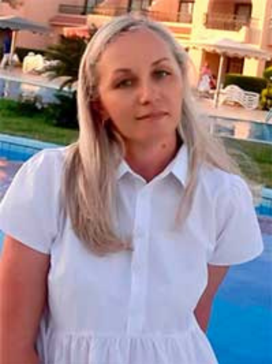
Красивое платье для «Масленицы».

Воспитанники младшей группы, МБДОУ детского сада 4 р.п. Тумботино на масляной недели украсили платье кукле «Масленице». Используя четыре основных цвета и ватные палочки, как средства нетрадиционного рисования. Платье крутится в разные стороны, меняя цвет. Тем самым закрепляя сенсорные представления. Сенсорное обогащение для детей 4-го года жизни направлено на формирование устойчивых эталонов формы, цвета, величины и развитие органов чувств через игру, творчество и исследование материалов. Акцент делается