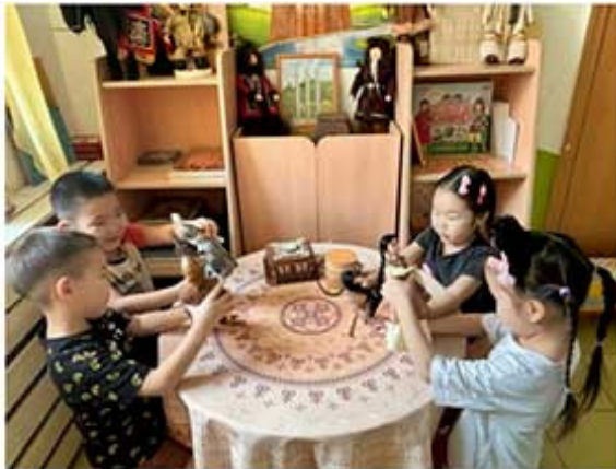
Учимся сопереживать героям якутского эпоса Олонхо