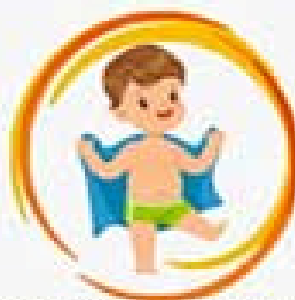
Обтирайтесь влажными полотенцами