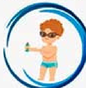
Загорайте на солнце