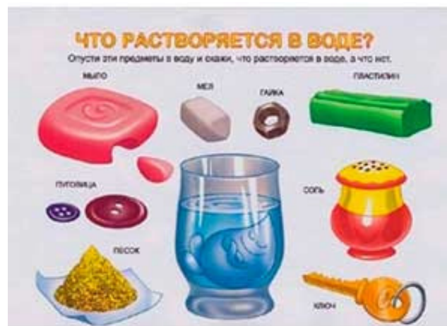
Плакат к опыту №2

Вывод: вода не имеет формы, но принимает форму того сосуда, в кото-