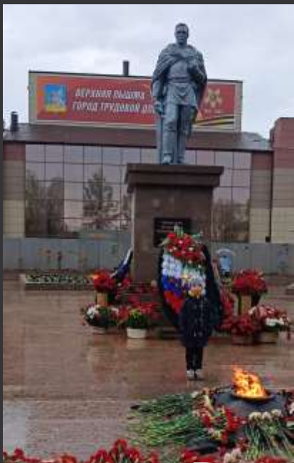
г. Верхняя Пышма