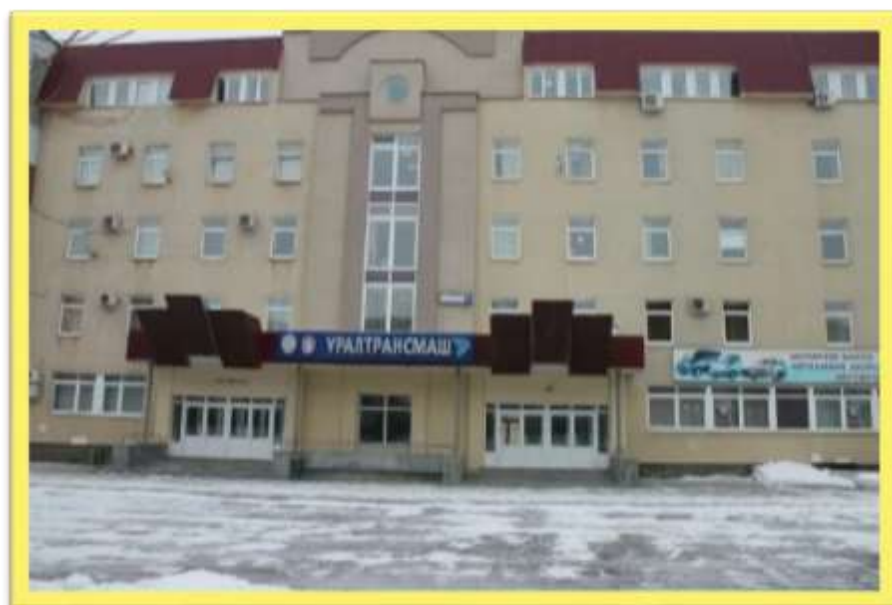
Современное здание завода Уралтрансмаш https://zavodfoto.livejournal.com/48736.html

Он соединил две части Екатеринбургскую машиностроительную и Мельковскую золотопромывальную фабрики- и стал основателем современного завода Уралтрансмаш.