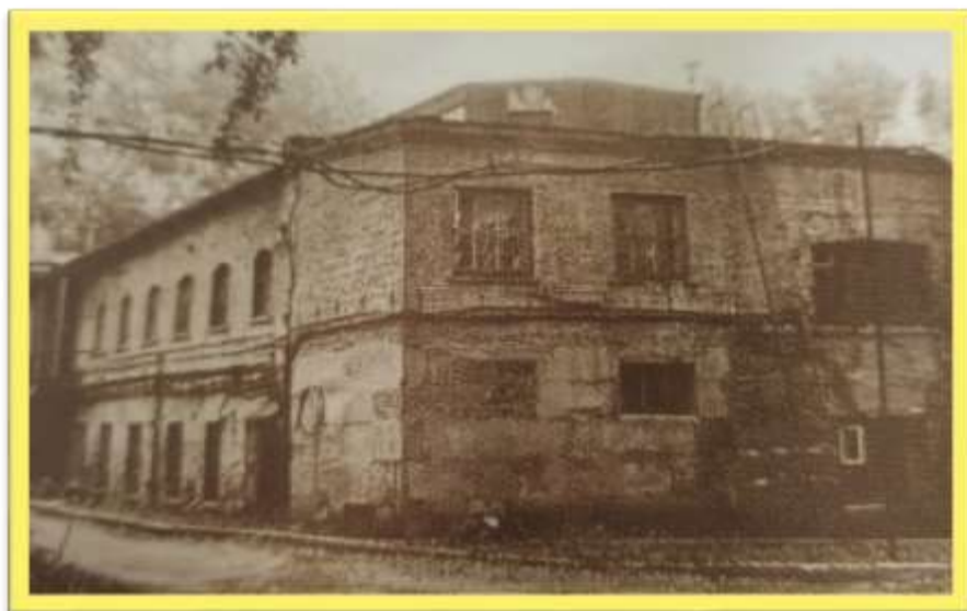
«Первое каменное здание Мельковской механической фабрики» Научно популярное издание «Мы можем все» Независимый Институт истории материальной культуры

Золото добывали много лет, его было так много, что он построил фабрику по добыче золота, но история золотой речки на этом не закончилась.