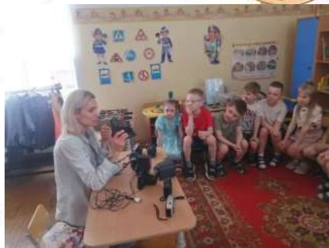
«Моя мама -фотограф»