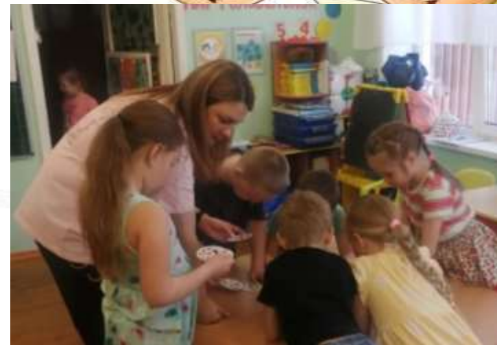
«Моя мама - психолог»