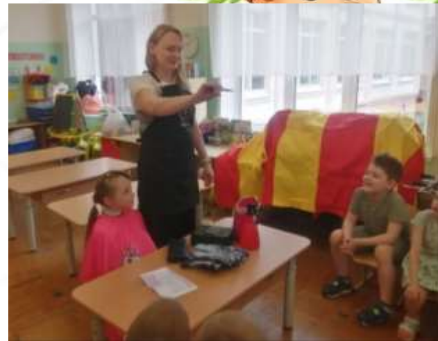
«Моя мама – парикмахер»