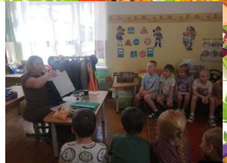
«Моя мама - бухгалтер»