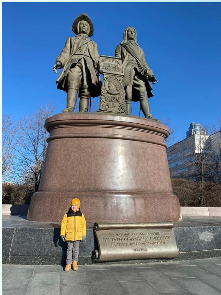
Памятник основателям Екатеринбурга находится в самом центре города, около Плотинки.