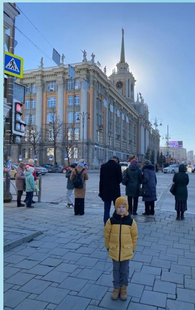
Здание администрации города Екатеринбурга