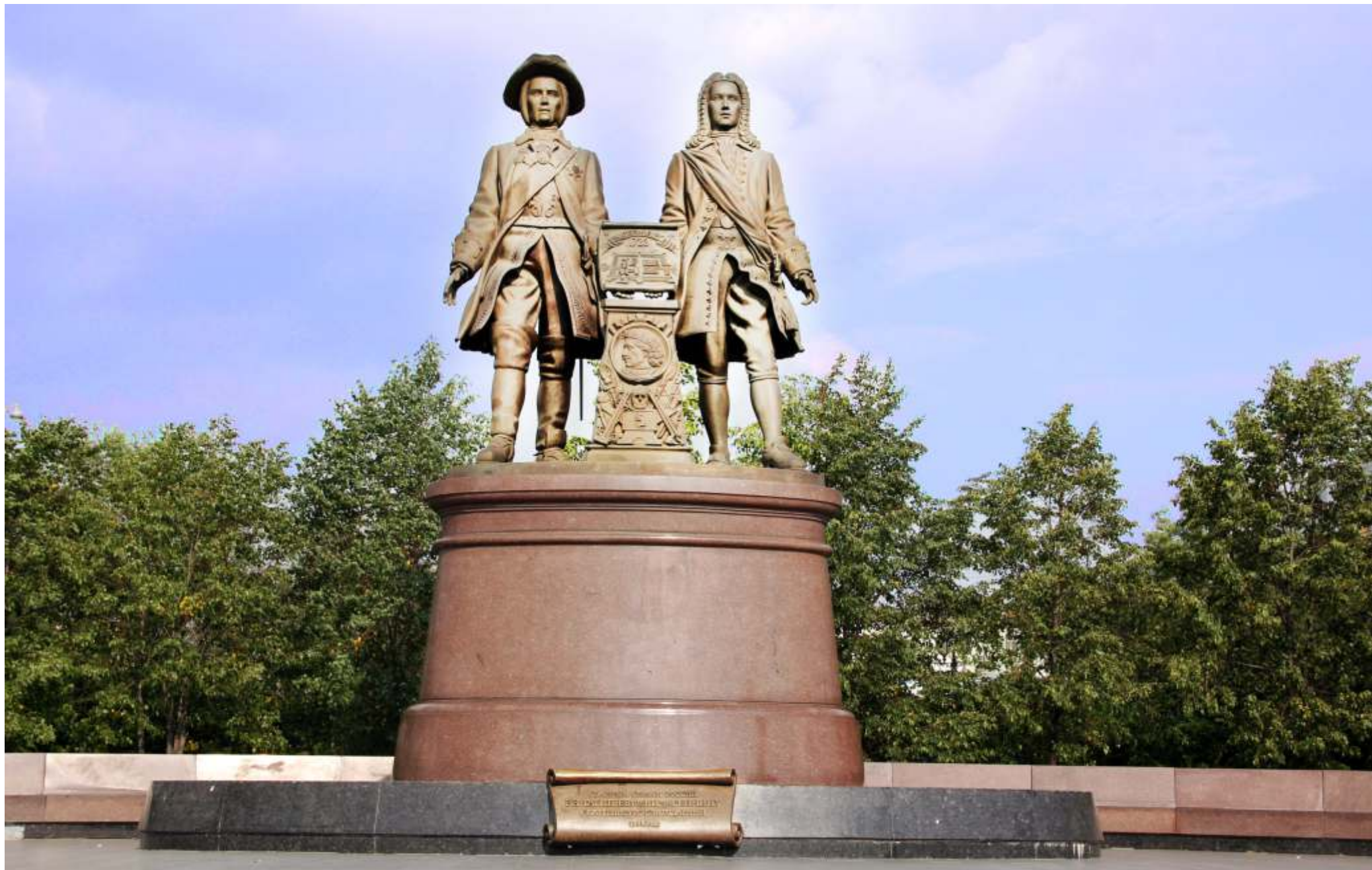
Памятник основателям Екатеринбурга