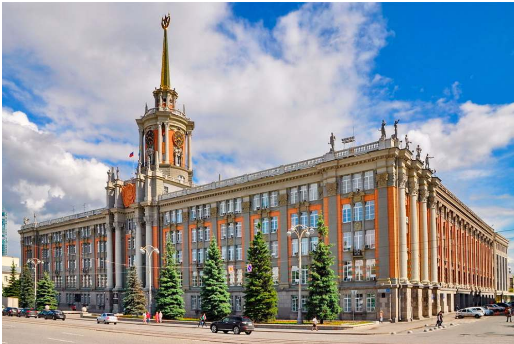
Здание администрации Екатеринбурга