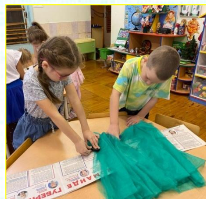
Юбка из одноразовых пеленок и газет, топ из коктейльных трубочек