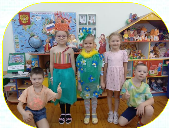
На этом решили не останавливаться и придумать наряды для всей команды