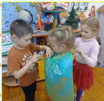
Наряд из полиэтиленового мешка