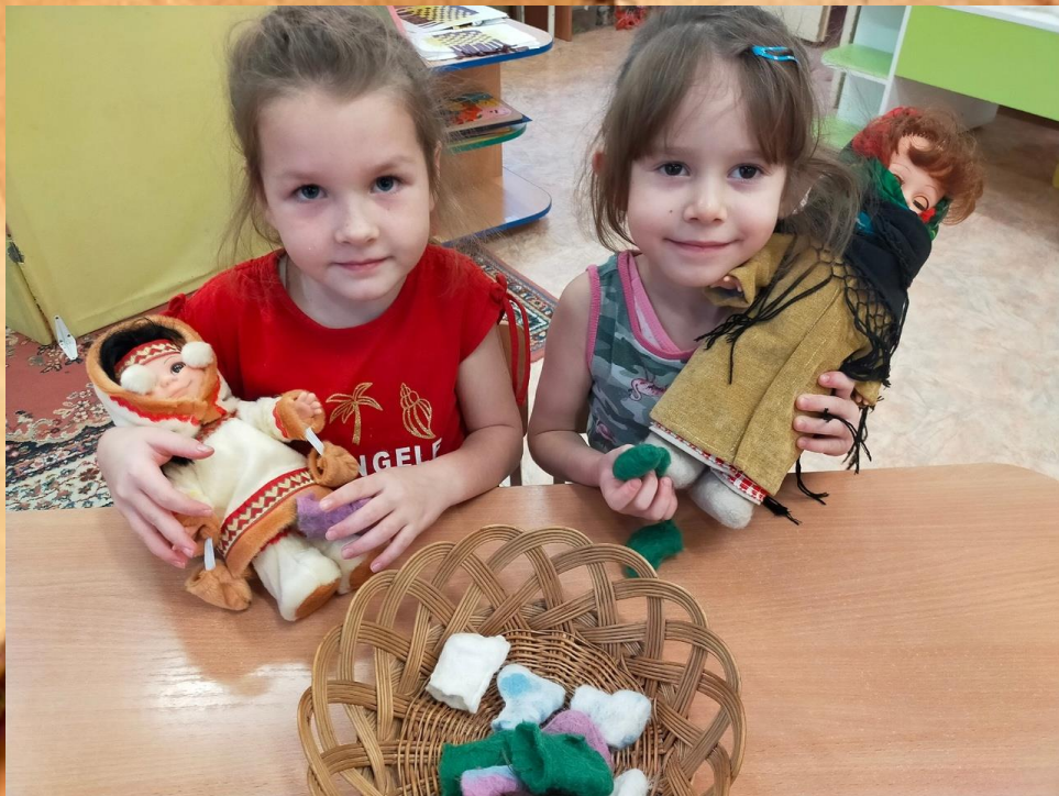
Подбери валенки для куклы