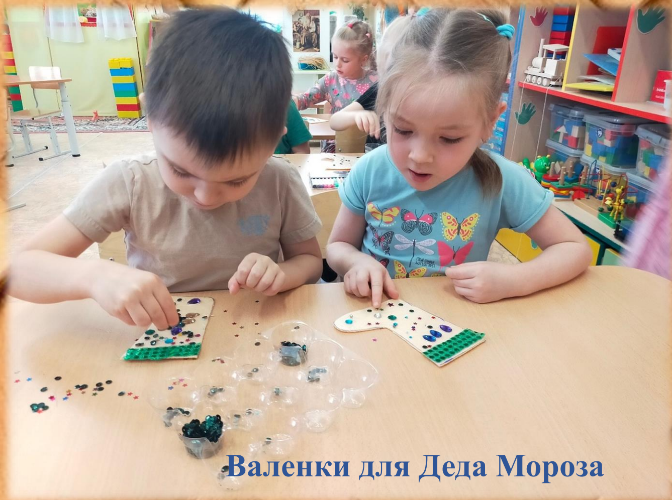
Валенки для Деда Мороза