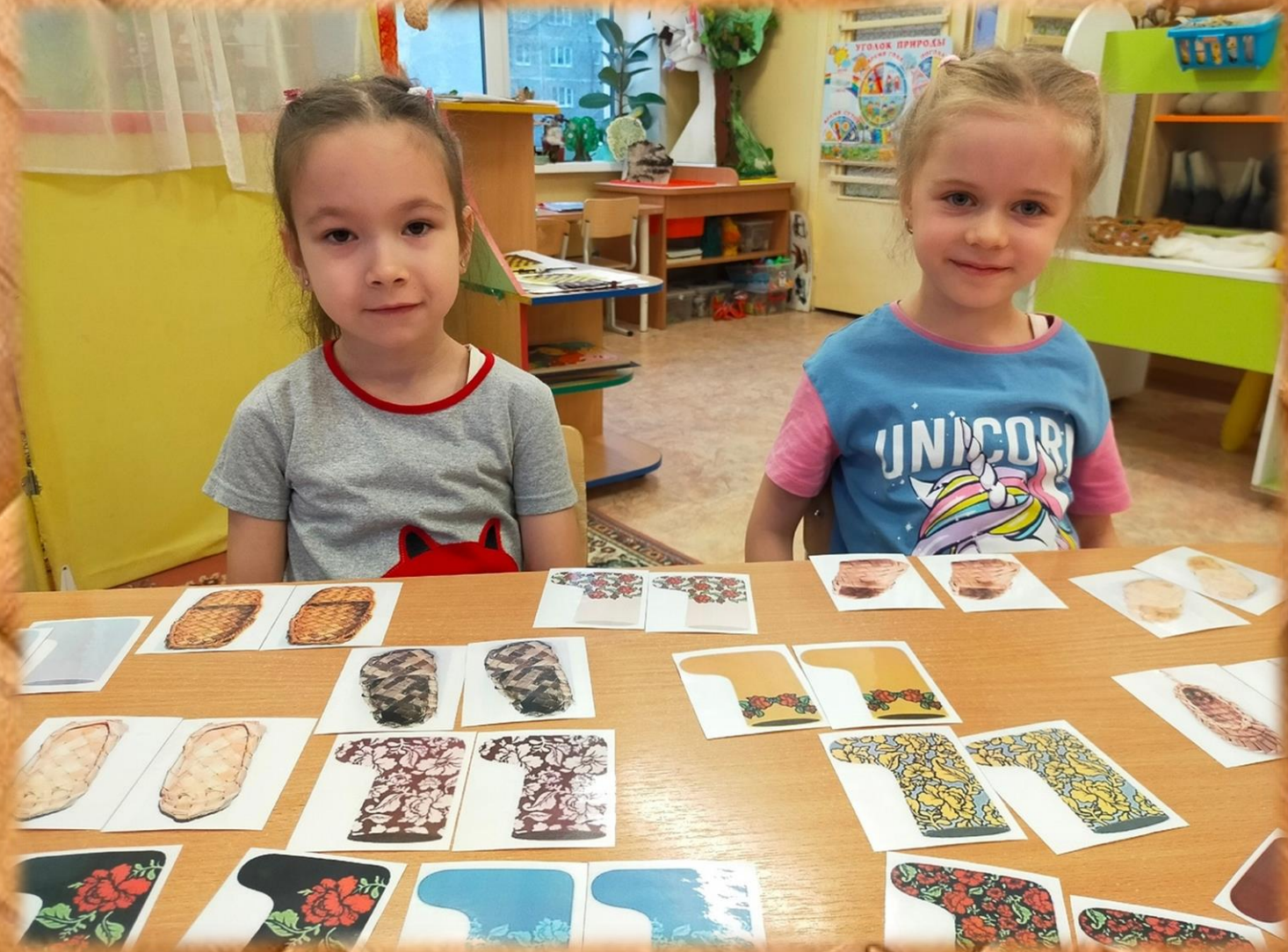
« Найди пару »